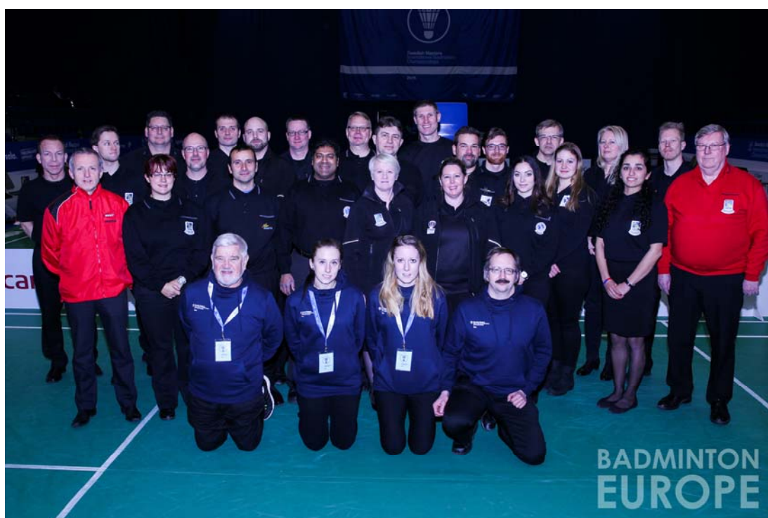
Tekniska staben vid Swedish Masters i Uppsala.