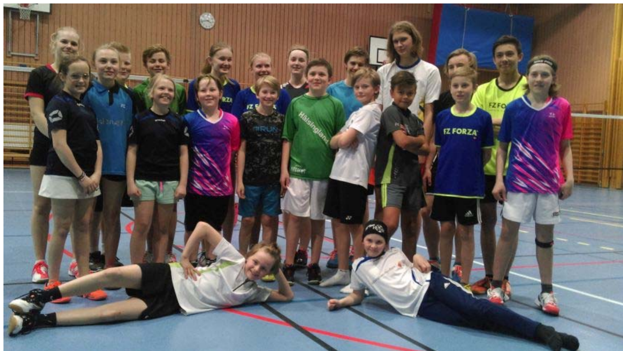
Badmintonungdomar på Svenska Cupen läget i Ljusdal 10 april 2016.

Som vanligt ordnades också en träningsdag inför Svenska Cupen. Söndag den 10 april samlades 22 stycken av de ungdomar som skulle spela Svenska Cupen i Uppsala på Giganten sporthall i Ljusdal. En mycket bra uppslutning där tjejerna och killarna drillades av Sören Norell.